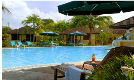
▲ Beringgis Beach Resort